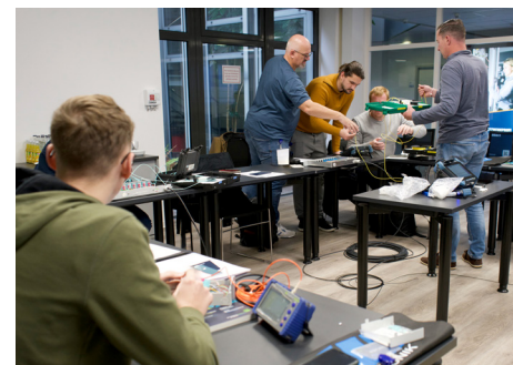
ALLE DREI SEMINARE ZUSAMMEN BUCHEN