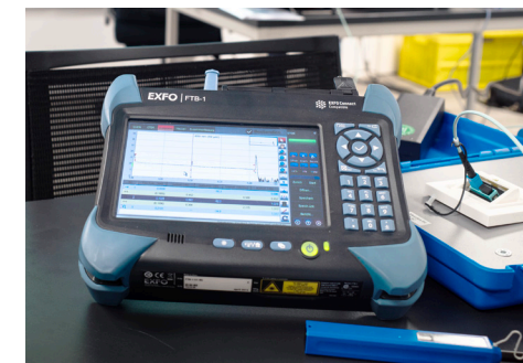
LWL MESSTECHNIK OTDR MESSUNGEN

ZUM SEMINARPROGRAMM UND WEITEREN INFORMATIONEN