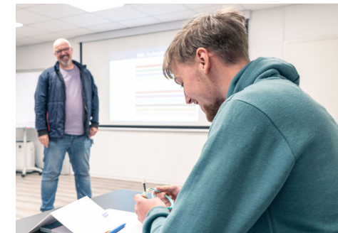
LWL GRUNDLAGEN MIT FTTX

Unser LWL Schulungsangebot findet an unseren Standorten in ganz Deutschland statt. Suchen Sie sich einfach die Termine aus, die in Ihrer Nähe angeboten werden: Bielefeld, Buxtehude (Hamburg), Puchheim (München) und Raunheim (Frankfurt a.M.).